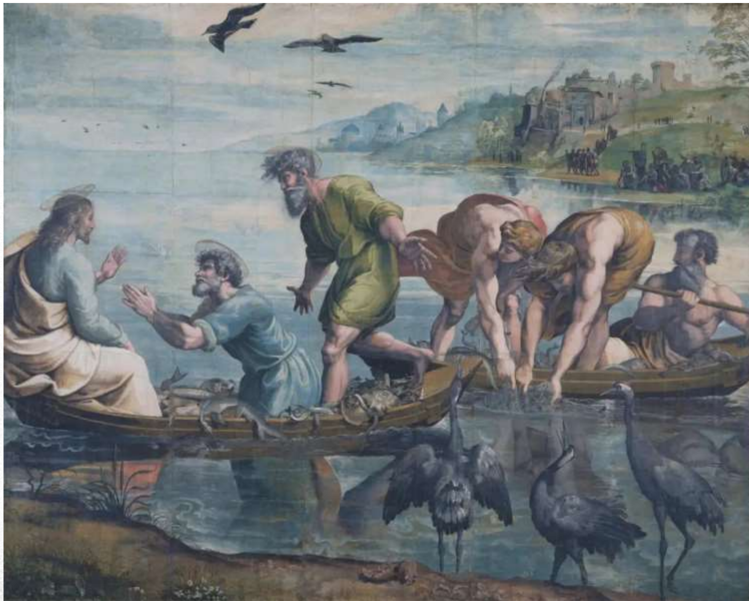
Pesca miracolosa Raffaello Sanzio 1515-1516