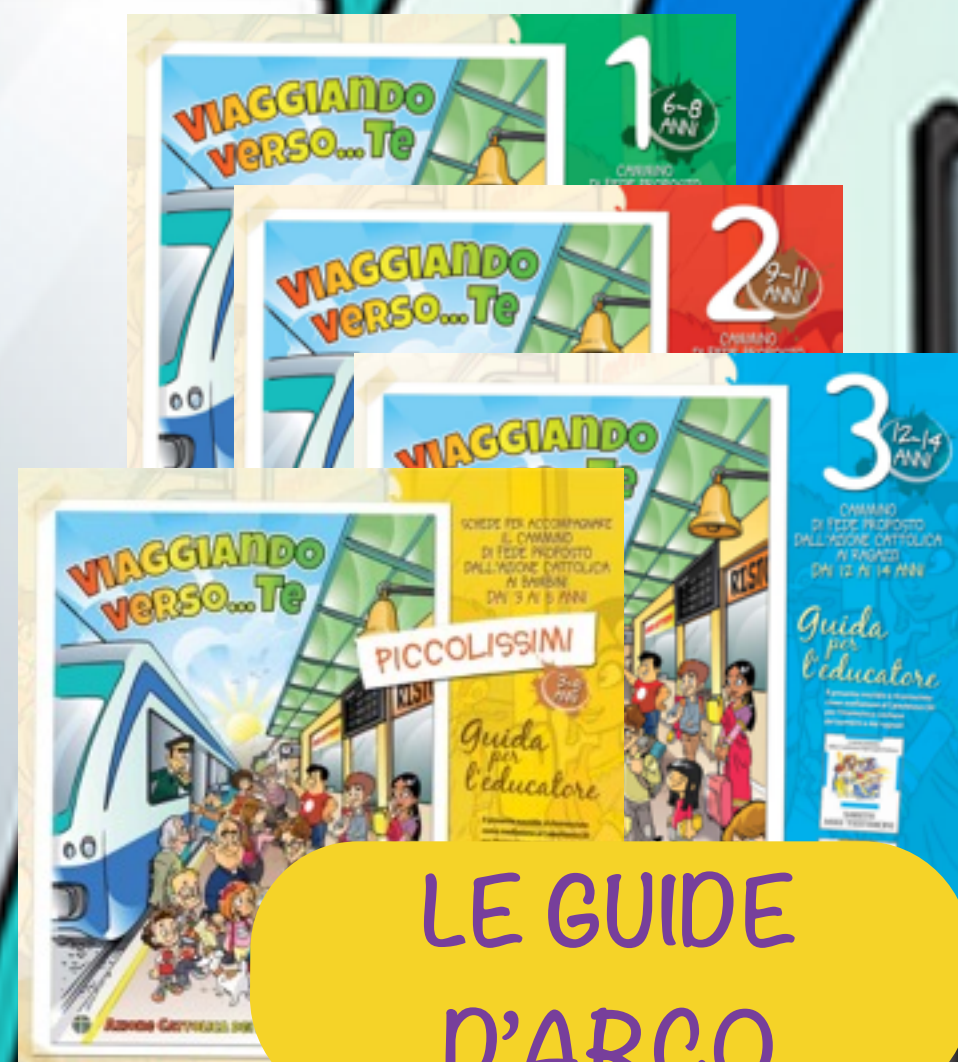
LE GUIDE D'ARCO