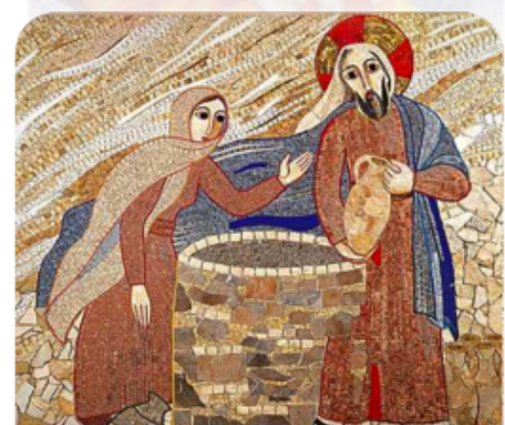
AL POZZO DI SICAR RITIRO DI AVVENTO

MIA FORZA e MIO CANTO È IL SIGNORE Is 12,1-6