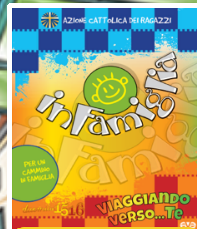
PER LE FAMIGLIE