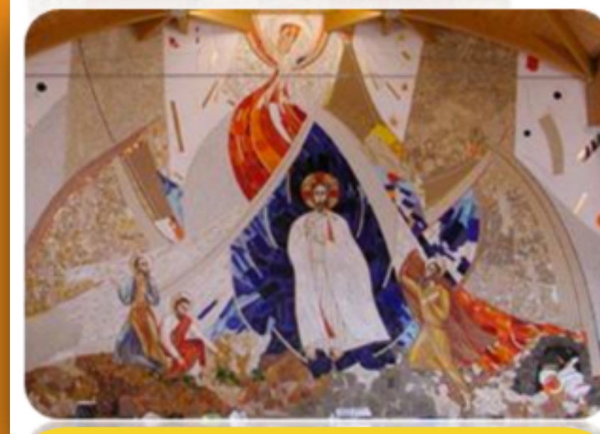
TABOR WEEK END 12/14

MIA FORZA e MIO CANTO È IL SIGNORE Is 12,1-6