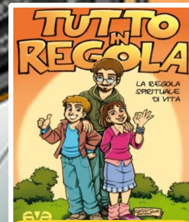
LA REGOLA DI VITA