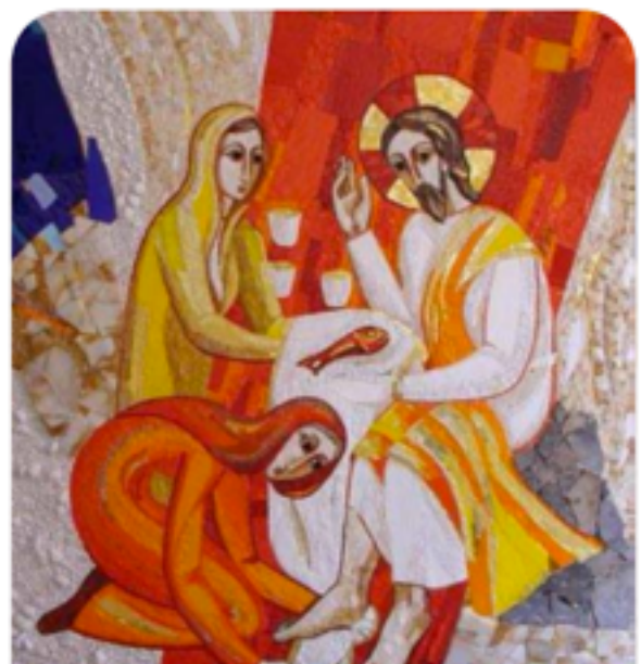
BETANIA LECTIO BRANO BIBLICO